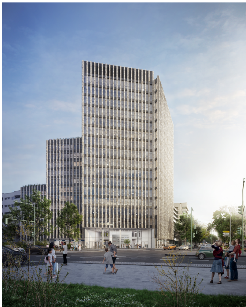
So soll das fertige Gebäude nach Abschluss der Bauarbeiten aussehen.