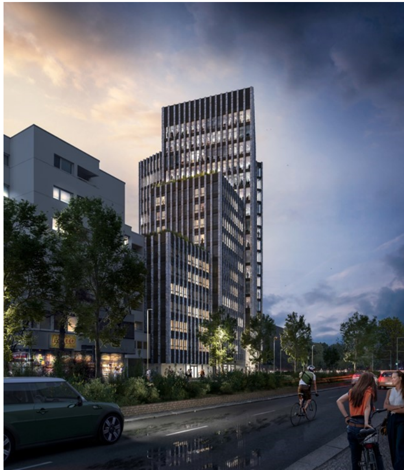
© Visualisierung: Jahr-Gruppe / HAMBURG TEAM Projektentwicklung