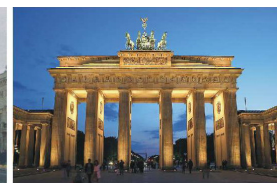
20251229 Seite 2 Nachhaltige Stadtentwicklung im Süden Berlins: Rundgang durch die Buckower Felder

Nachhaltigkeit spielt dabei eine zentrale Rolle. Das Energiesystem basiert auf der Rückgewinnung von Abwasserwärme und wird durch Photovoltaikanlagen ergänzt. Zusätzlich soll ein Schwammstadt-Konzept die effiziente Regenwassernutzung fördern und die Biodiversität steigern. Außerdem sollen CO 2 -neutrale Wärmeversorgung und begrünte Dächer zusätzlich zur Klimafreundlichkeit des Quartiers beitragen.