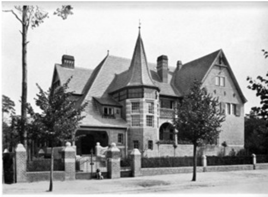
Villa Paulus, Berlin-Dahlem, 1910