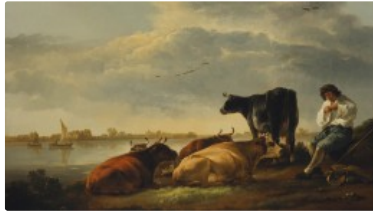
FRICK COLLECTION IN DEN HAAG

Ihre Studien zu Drosophila-Fliegen brachten ihr den Nobelpreis für Medizin ein, und selbst im Ruhestand forscht Christiane Nüsslein-Volhard weiter. Heute wird sie achtzig Jahre alt.