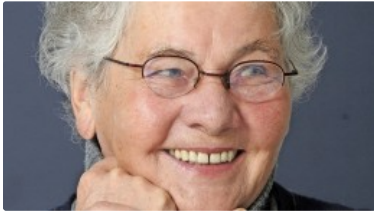
CHRISTIANE NÜSSLIN-VOLHARD 80