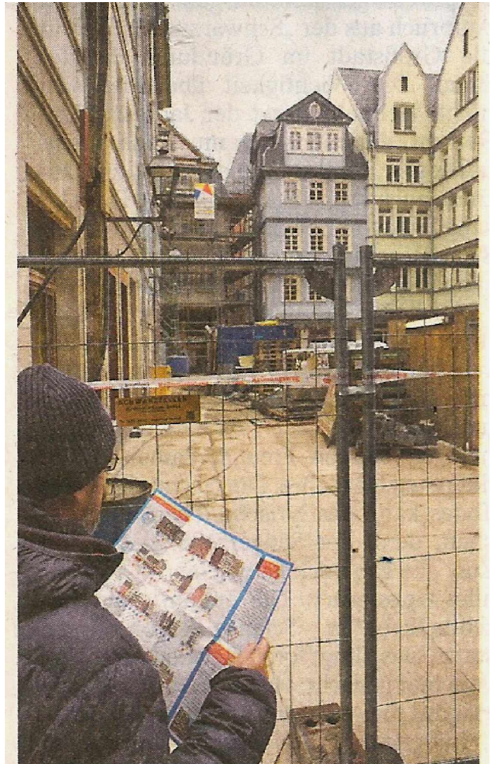
Am Freitag, dem 9. Februar 2018, war der Königsweg in der neuen Frankfurter Altstadt für jedermann zugänglich.

B) Der Bauch von Frankfurt in neuem Gewand