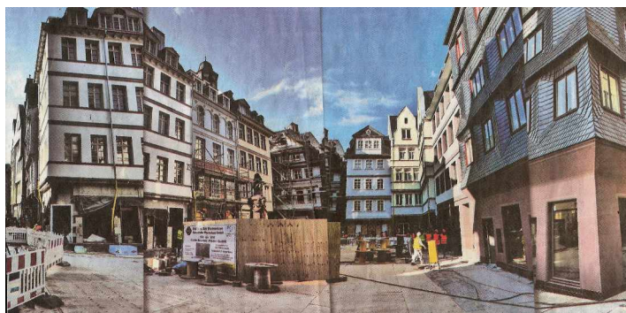
Herzstück der neuen Altstadt: der Hühnermarkt. Der Mundartdichter Friedrich Stoltze reckt seinen Kopf schon einmal über den Bauzaun und verfolgt die Arbeiten.

Ich sitze am schönsten und nutzlosesten Ort Frankfurts. Auf dem Boden, auf Sperrholzplatten, inmitten einer Baustelle, Auge in Auge mit dem Domturm. Ich sitze hier mit innerer Bewegung, das muss ich, zugeben, und die Gründe gehören erwogen. Diese Geschichte ist eine lange, sie hat vor drei Jahrzehnten begonnen. Damals zog ich nach Frankfurt zum Studium, und natürlich hatte ich ein gewisses diffuses Bild vom Vorkriegsfrankfurt im Kopf. Manchmal betrachtete ich Bildbände über das alte Frankfurt, was seltsam klingen mag: als noch fast jugendlicher "Bildbände über das alte Frankfurt" zu betrachten. Meine Kenntnisnahme der Baulichkeiten war denn auch nicht gerade detailliert, ich sah alte enge Gassen vor mir und Häuser, die den Anschein des absolut Idyllischen hatten und über die 'jeder sagte, dort gewohnt zu haben muss, absolut scheußlich gewesen sein. Also die alte Altstadt Frankfurts.